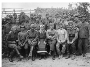
Zdjęcie 007. Żołnierze ze SPRA we Włodzimierzu Wołyńskim przed budynkiem pokrytym siomianą strzechną. Zdjęcie wykonane podczas ćwiczeń wojskowych na poligonie artyleryjskim między wsią Powórska i Czeremoszno w powiecie kowieńskim na Wołyniu. Pierwszy od prawej siedzi kpr.