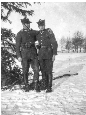
Zdjęcie 024. Żołnierze ze SPRA we Włodzimierzu Wołyńskim w mundurach garnizonowych w rogatywkach. Na koinierzach kurtki mundurowej - łapki z galonami szeregowca (kanoniera). Przy