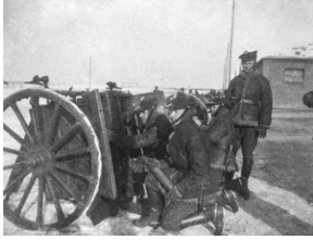
Zdjęcie 019. Żołnierze ze SPRA we Włodzimierzu Wołyńskim podczas szkolenia artyleryjskiego przy jaszczu do transportu amunicji do armaty polowej 75 mm. Lata 1932-1933.