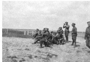
Zdjęcie 022. Żołnierze i oficerowie ze SPRA we Włodzimierzu Wołyńskim w czasie ćwiczeń wojskowych na poligonie artyleryjskim między wsią Powórsk i Czeremoszno w powiecie kowelskim na Wołyniu. Lata 1932-1933.