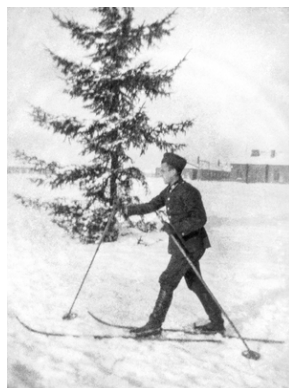
Zdjęcie 025. Żołnierz ze SPRA we Włodzimierzu Wołyńskim w mundurze garnizonowym, w futerażerce, na nartach.