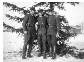
Zdjęcie 026. Żołnierze z SPRA we Włodzimierzu Wołyńskim w mundurach garnizonowych w rogatywkach. Na koinierzach kurtki mundurowej - łapki z galonami szeregowca (kanoniera). Przy pasach głównych ładownice skórzane na naboje karabinowe.