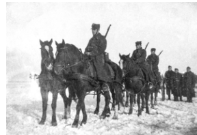
Zdjęcie 023. Żołnierze ze SPRA we Włodzimierzu Wołyńskim podczas szkolenia artyleryjskiego. Na pierwszym planie zaprzęg sześciokonny, bezorcycowy w uprzęży szorowej, ciągnący armatę polową 75 mm wz. 1897.