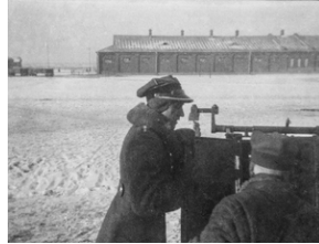
Zdjęcie 020. Żołnierze ze SPRA we Włodzimierzu Wołyńskim podczas szkolenia artyleryjskiego. Na drugim planie budynki kószarowe (prawdopodobnie stajnie).