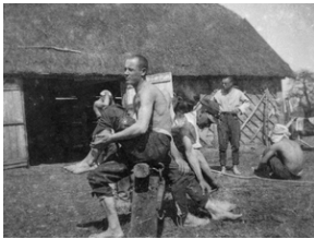
Zdjęcie 021. Żołnierze ze SPRA we Włodzimierzu Wołyńskim przed budynkiem pokrytym słomianą strzechą. Zdjęcie wykonane podczas ćwiczeń wojskowych na poligonie artyleryjskim między wsią Powórsk i Czeremoszno w powiecie kowelskim na Wołyniu.