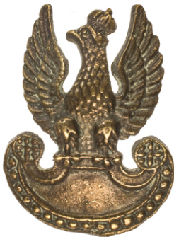
Orzełek metalowy używany przez żołnierzy PSZ na Zachodzie, noszony na furażerce przez por. Władysława Jaksana.