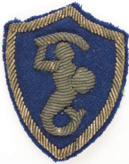
Noszona przez por. Władysława Jaksana odznaka rozpoznawcza 2 Korpusu Polskiego - syrenka - noszona na lewym rękawie munduru żołnierzy Bazy 2 Korpusu Polskiego. Syrenka wyhaftowana srebrną nicią na granatowym tle.