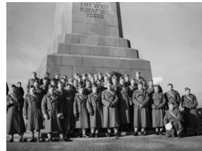
Grupa polskich oficerów pod pomnikiem „TO THE MEMORY OF DUNDEE MEN WHO FELL IN THE GREAT WAR 1914-1918” usytuowanym w Dundee w Szkocji.