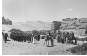
Polscy żołnierze w pobliżu niewidocznego na zdjęciu Wielkiego Sfinksa koło miasta Giza. W centralnej części zdjęcia widoczny jest fotograf z dużym aparatem fotograficznym ustawionym na statywie. Z prawej strony widać żołnierzy siedzących na wielbłądach, pozujących do fotografii oraz miejscowych Egipcjan w charakterystycznych turbanach na głowach.