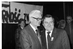
Zdjęcie 034. Sesja zdjęciowa Lecha Wałęsy z kandydatami do sejmiku i senatu w Sali BHP Stoczni Gdańskiej im. Lenina 29 kwietnia 1989 r. Lech Wałęsa z Januszem Ziółkowskim, kandydatem do senatu.