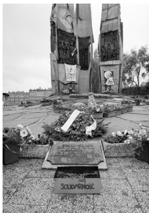
Zdjęcie 004. Pomnik Poległych Stoczniovców 1970 w Gdańsku z wieńcem złożonym przez Lecha Wałęsę, 29 kwietnia 1989 r.