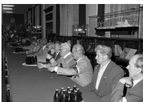
Zdjęcie 024. Kombatanci na spotkaniu kandydatów do sejmiku i senatu z Lechem Wałęsą w Sali BHP Stoczni Gdańskiej im. Lenina 29 kwietnia 1989 r.