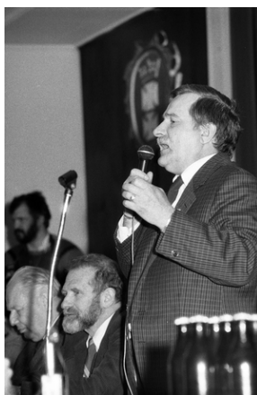
Zdjęcie 026. Lech Wałęsa przemawia przy stole prezydańskim w Sali BHP Stoczni Gdańskiej im. Lenina w dniu spotkania z kandydatami do sejmiku i senatu 29 kwietnia 1989 r. Od lewej: