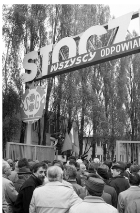
Zdjęcie 008. Kandydaci do sejmu i senatu z ramienia Komitetu Obywatelskiego „Solidarność” przed bramą Stoczni Gdańskiej im. Lenina, 29 kwietnia 1989 r.