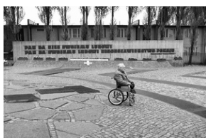
Zdjęcie 007. Mężczyzna na wózku inwalidzkim przy Pomniku Poległych Stoczniovców 1970 w Gdańsku, 29 kwietnia 1989 r.