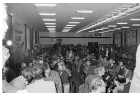
Zdjęcie 022. Kandydaci do sejmiku i senatu w Sali BHP Stoczni Gdańskiej im. Lenina 29 kwietnia 1989 r. Fot. Igor Witowicz.