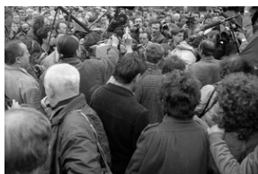
Zdjęcie 006. Dziennikarze filmują i fotografują Lecha Wałęsę po złożeniu wieńca przy Pomniku Poległych Stoczniovców 1970 w Gdańsku, 29 kwietnia 1989 r.