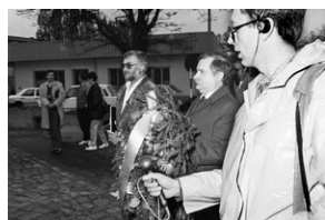
Zdjęcie 001. Lech Wałęsa, jego współpracownicy i kandydaci do sejmu i senatu z ramienia Komitetu Obywatelskiego „Solidarność” idą pod Pomnik Poległych Stoczniovców 1970 w Gdańsku, 29 kwietnia 1989 r. Na zdjęciu

Igor Witowicz, starszy kustosz w Oddziałowym Archiwum IPN w Rzeszowie