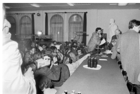
Zdjęcie 023. Dziennikarze i kandydaci do sejmiku i senatu w Sali BHP Stoczni Gdańskiej im. Lenina 29 kwietnia 1989 r.