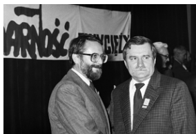
Zdjęcie 035. Sesja zdjęciowa Lecha Wałęsy z kandydatami do sejmiku i senatu w Sali BHP Stoczni Gdańskiej im. Lenina 29 kwietnia 1989 r. Lech Wałęsa z Pawłem Łączkowskim, kandydatem do senatu. Fot. Igor Witowicz.

Andrzej Stelmachowski i Bronisław Geremek. Fot. Igor Witowicz.