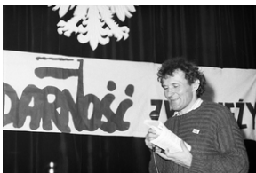
Zdjęcie 041. Sesja zdjęciowa Lecha Wałęsy z kandydatami do sejmu i senatu w Sali BHP Stoczni Gdańskiej im. Lenina 29 kwietnia 1989 r. Henryk Wujec odczytuje nazwiska kandydatów, którzy podchodzą do zdjęcia.