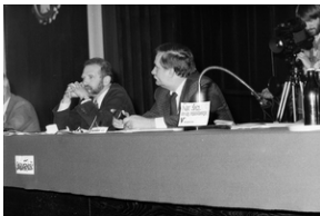
Zdjęcie 030. Lech Wałęsa i jego współpracownicy przy stole prezydiálním w Sali BHP Stoczni Gdańskiej im. Lenina w dniu spotkania z kandydatami do sejmiku i senatu 29 kwietnia 1989 r. Od lewej: Lech Wałęsa i Bronisław Geremek.