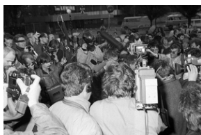
Zdjęcie 005. Dziennikarze filmują i fotografują Lecha Wałęsę po złożeniu wieńca przy Pomniku Poległych Stoczniovców 1970 w Gdańsku, 29 kwietnia 1989 r.