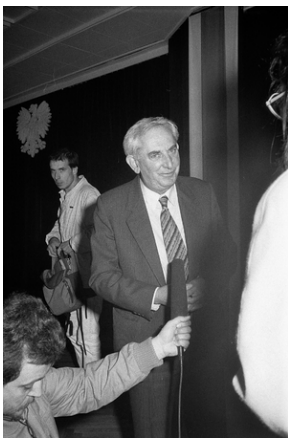
Zdjęcie 021. Gustaw Holóubek, kandydat do senatu z ramienia KO „S” w Krośnie, udziela wywiadu podczas spotkania Lecha Wałęsy z kandydatami do sejmiku i senatu w Sali BHP Stoczni Gdańskiej im. Lenina 29 kwietnia 1989 r.