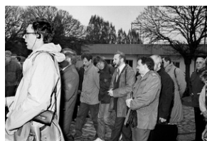
Zdjęcie 002. Lech Wałęsa, jego współpracownicy i kandydaci do sejmu i senatu z ramienia Komitetu Obywatelskiego „Solidarność” idą pod Pomnik Poległych Stoczniovców 1970 w Gdańsku, 29 kwietnia 1989 r. Na zdjęciu