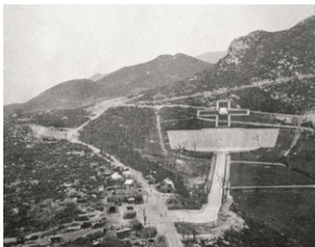
Zdjęcie 019. Budowa Polskiego Cmentarza Wojennego na Monte Cassino, zdjęcie wykonane na przełomie lipca i sierpnia 1945 r.