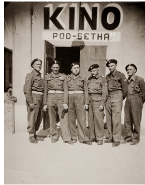
Zdjęcie 017. Polscy żołnierze w Maceracie we Włoszech przed wojskowym kinem „POD-SETHA”, ok. 1945 r.