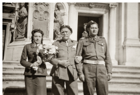
Zdjęcie 026. Pamiątkowe zdjęcie zrobione przed Sanktuarium Santa Casa w Loreto, ok. 1946 r. Na zdjęciu prawdopodobnie państwo młodzi ze stojącym w środku porucznikiem WP.