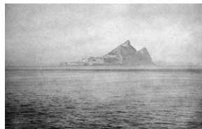
Zdjęcie 040. Skała Gibraltarska widziana z okrętu, którym żołnierze polscy służący w 2 Warszawskiej Dywizji Pancerniej przyjeżdżali z Włoch do Wielkiej Brytanii latem 1946 r.