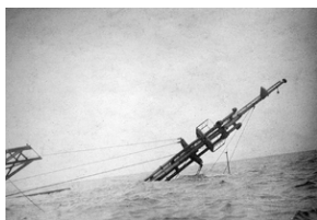
Zdjęcie 010. Zniszczenia wojenne w porcie w Ankonie w 1945 r.