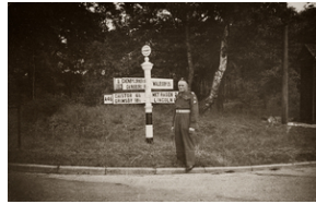
Zdjęcie 045. Plut. Michał Bar przy drogowskazu na skrzyżowaniu dróg w hrabstwie Lindsey na przełomie lat 1946/47.