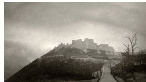
Zdjęcie 020. Ruiny klasztoru Benedyktynów na Monte Cassino, zdjęcie wykonane na przełomie lipca i sierpnia 1945 r.