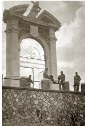
Zdjęcie 022. Brama Polskiego Cmentarza Wojennego w Loreto, zdjęcie wykonane prawdopodobnie wiosną 1946 r.