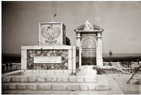
Zdjęcie 021. Budowa Polskiego Cmentarza Wojennego w Loreto, zdjęcie wykonane prawdopodobnie wiosną 1946 r. (poświęcenie cmentarza miało miejsce 6 maja 1946 r.)