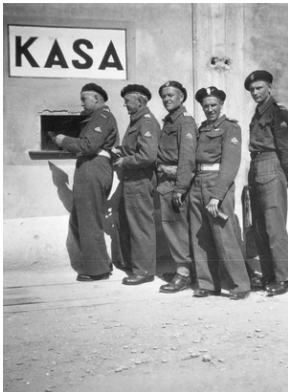
Zdjęcie 016. Polscy żołnierze 2 Warszawskiej Dywizji Pancernej w Maceracie we Włoszech kolejce po żytd.