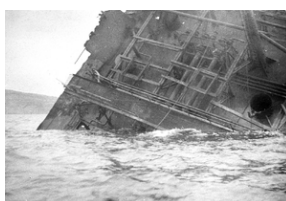
Zdjęcie 009. Zniszczenia wojenne w porcie w Ankonie w 1945 r.