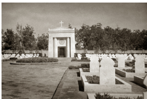
Zdjęcie 024. Polski Cmentarz Wojenny w Loreto, zdjęcie wykonane prawdopodobnie wiosną 1946 r.