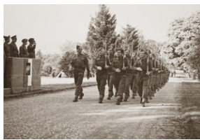
Defilada oddziałów polskich w Iraku przed Naczelnym Wodzem i premierem rządu RP na uchodźstwie gen. broni W. Sikorskim. Na trybunie honorowej pierwszy z prawej gen. broni W. Sikorski, obok niego gen. dyw. Marian Kukiel, czerwiec 1943 r.