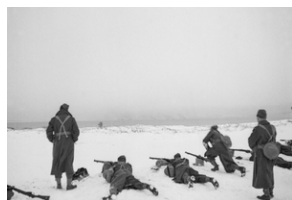
Polski żołnierze podczas szkolenia terenowego w nieznannej nadmorskiej miejscowości na terenie Szkocji ok. 1941 r. Ubrani są w piaszcze sukienne z oporządzeniem P-37, na głowach mają furazętki typu brytyjskiego. Używają karabinów brytyjskich typu Lee-Enfield.