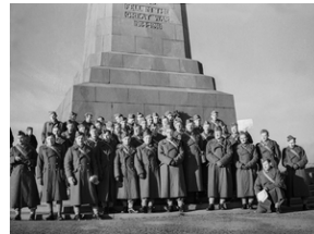
Grupa polskich oficerów pod pomnikiem „TO THE MEMORY OF DUNDEE MEN WHO FELL IN THE GREAT WAR 1914-1918” usytuowanym w Dundee w Szkocji.