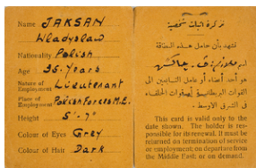
Legitymacja wojskowa por. Władysława Jaksana wystawiona 4 października 1943 r. w Palestynie, 2 strona.