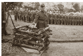
Ognisko żołnierskie w nieznannej miejscowości w Iraku z udziałem Naczelnego Wodza, gen. W. Sikorskiego podczas jego inspekcji Armii Polskiej na Wschodzie w czerwcu