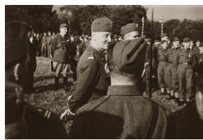
Ognisko żołnierskie w nieznannej miejscowości w Iraku z udziałem gen. W. Sikorskiego, podczas jego inspekcji Armii Polskiej na Wschodzie w czerwcu 1943 r. Na pierwszym planie gen. W. Sikorski przy