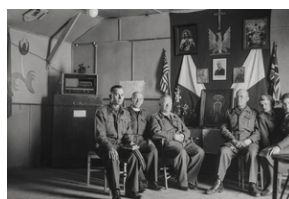
Kapelani wojskowi i dwie umundurowane kobiety w kaplicy