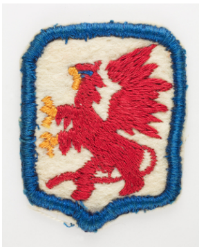
Noszona przez por. Władysława Jaksana odznaka rozpoznawcza 7 Zapasowej Dywizji Piechoty 2 Korpusu Polskiego (Czerwony gryf na białym polu).