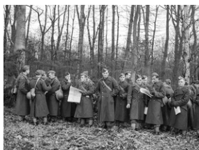
Polski oficerowie podczas szkolenia topograficznego na terenie Szkocji ok. 1941 r. Ubrani są w piaszcze sukienne, na głowach mają furazętki typu brytyjskiego.