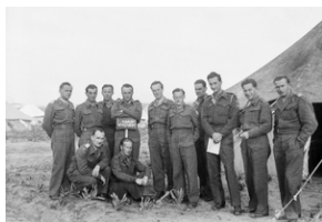
Polscy oficerowie ubrani w battledress-y stoją przed namiotem wojskowym. Oficer piąty od prawej ma na ramieniu naszywkę 7 Zapasowej DP, używanej od końca 1942 r. Zdjęcie wykonane prawdopodobnie w Iraku, być może w marcu 1943 r. koło Bagdadu, podczas kursu „Poznaj swego wroga”.