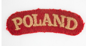
Noszona przez por. Władysława Jaksana odznaka naramienna 2 Korpusu Polskiego - Poland. Napis wyhaftowany nicią koloru fososowego na materiale koloru czerwonego.