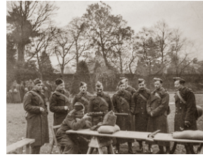
Polscy oficerowie podczas nauki strzelania karabinem Lee-Enfield. Ubrani są w płaszcze sukienne, na głowach mają furażerki typu brytyjskiego. Zdjęcie wykonane w Szkocji ok. 1941 r.