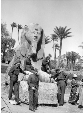
Polscy oficerowie (wśród nich jedna kobieta) przy antycznym sfinksie w Egipcie. Po prawej stronie widoczne są dwie miejscowe dziewczyny o ciemnej karnacji skóry. Zdjęcie wykonane przez W. Jaksana na początku 1944 r.