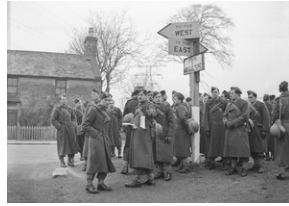
Polscy oficerowie podczas szkolenia terenowego w Szkocji ok. 1941 r. Ubrani są w płaszcze sukienne, na głowach mają furażerki typu brytyjskiego.