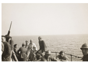
Żołnierze i osoby cywilne na statku podczas ewakuacji z Francji (z portu La Rochelle) do Wielkiej Brytanii. Na zdjęciu widoczni są żołnierze w hełmach typu francuskiego.