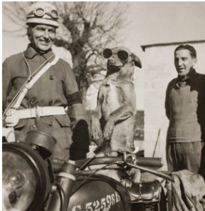
Żołnierz jednostki regulacji ruchu z wytresowanym psem. prawdopodobnie w Wielkiej Brytanii w 1947 r.