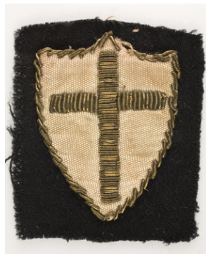
Noszona przez por. Władysława Jaksana odznaka honorowa 2 Korpusu Polskiego, tzw. „tarcza krzyżowców” – odznaka rozpoznawcza 8 Armii Brytyjskiej noszona przez żołnierzy