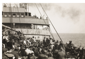
Żołnierze i osoby cywilne na statku podczas ewakuacji z Francji (z portu La Rochelle) do Wielkiej Brytanii. Na zdjęciu widoczni są żołnierze w hełmach typu francuskiego. po 19 czerwca 1940 r.