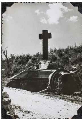
Pomnik Pułku 4 Pancernego „Skorpion”.

krzyżykiem). Pod zdjęciem podpis: Grób ppor. KRUPSKI Kazimierza w Acquafontata. Poległ na wzgórzu St. Angelo.