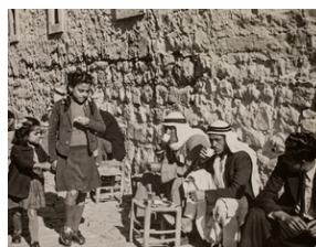
Zdjęcie z opisem na odwrocie: Fragment z życia Arabów w starej Jerozolimie, dnia 21 XII 1942 r.