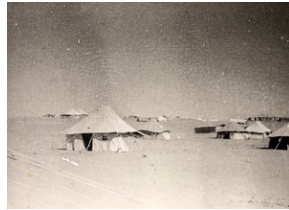
. Zdjęcie z opisem na odwrocie: Na pustyni w Iraku. Tak się mieszkało. Kanakin [Khanakin], 3 X 1942 r.