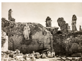
Zdjęcie z opisem na odwrocie: Ruiny klasztoru na Monte Cassino, maj 1945 r.