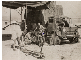
W warsztacie wojskowym w Palestynie 10 października 1943 r. Przegląd motoru przed dalszą drogą. Oznaczony krzyżykiem - por. E. Czwaczka.