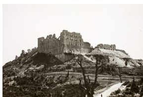
Zdjęcie z opisem na odwrocie: Widok klasztoru na Monte Cassino, po zdobyciu. Monte Cassino, maj 1945 r.