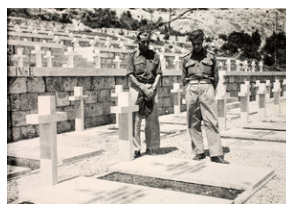
Polscy żołnierze na grobach kolegów na Polskim Cmentarzu Wojennym znajdującym