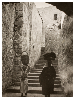
Zdjęcie z opisem na odwrocie: Jedna z ulic w starej Jerozolimie. Jerozolim, dnia 21 XII 1942 r.