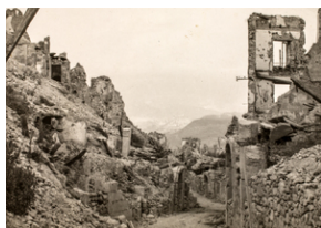
Zdjęcie z opisem na odwrocie: Jedna z ulic miasteczka Cassino po zdobyciu – tak wyglądało całe miasto, maj 1945 r.