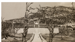
Polski Cmentarz Wojenny pod Monte Cassino w 1945 r.

się poniżej Monte Cassino. Zdjęcie wykonane po 02-09-1945 r. Pod zdjęciem podpis: Żołnierze polscy pogrążeni w rozmyślaniach na grobach swych kolegów poległych na ziemi włoskiej za Polskę.