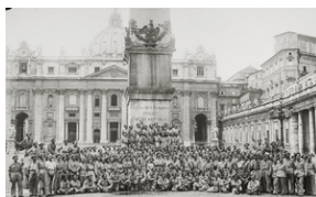
Żołnierze 5. Kresowej Dywizji Piechoty wchodzącej w skład 2 Korpusu Polskiego, stojący na Placu św. Piotra na Watykanie.