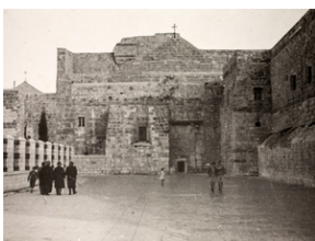
Zdjęcie z opisem na odwrocie: Bazylika Narodzenia w Betlejem. Betlejem, 20 XII 1942 r.