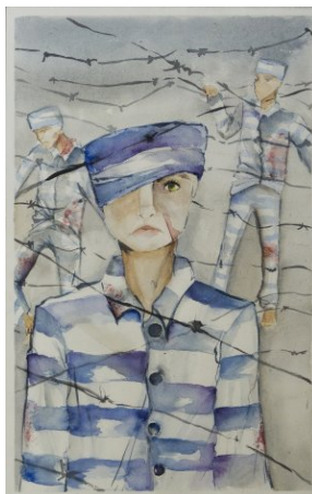
Nagrodzone prace konkursowe.