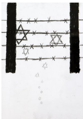
Nagrodzone prace konkursowe.

Wystawa pokonkursowych prac plastycznych prezentowana jest na Uniwersytecie Rzeszowskim, w budynku przy ul. Rejtana 16 C.