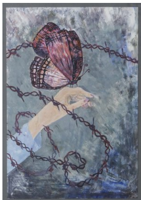
Nagrodzone prace konkursowe.