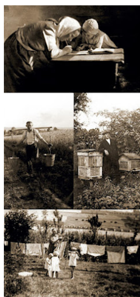
Broszura Rodzina Ulmów 005