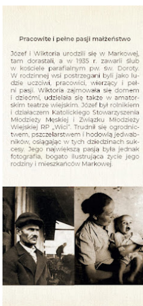
Broszura Rodzina Ulmów 004