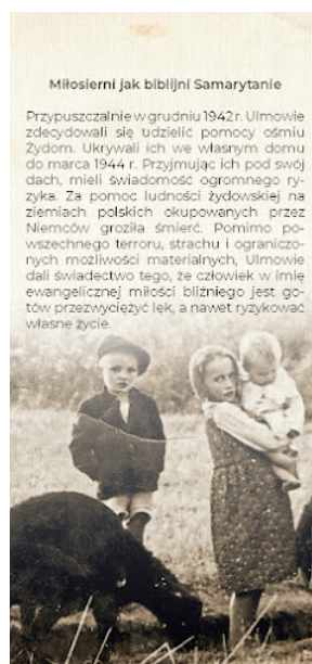
Broszura Rodzina Ulmów 006