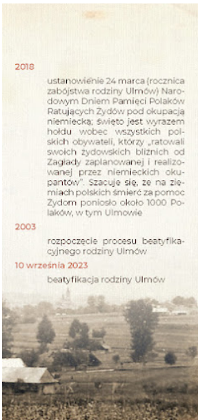
Broszura Rodzina Ulmów 011