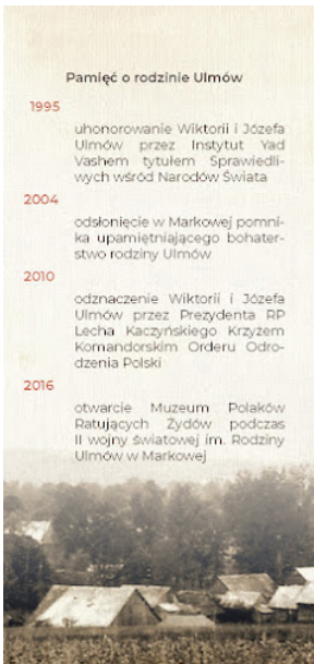
Broszura Rodzina Ulmów 010