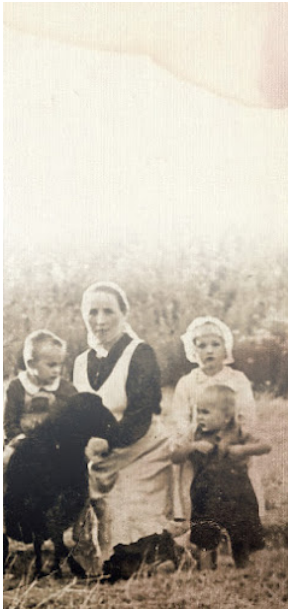
Broszura Rodzina Ulmów 007