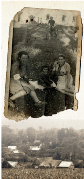
Broszura Rodzina Ulmów 009