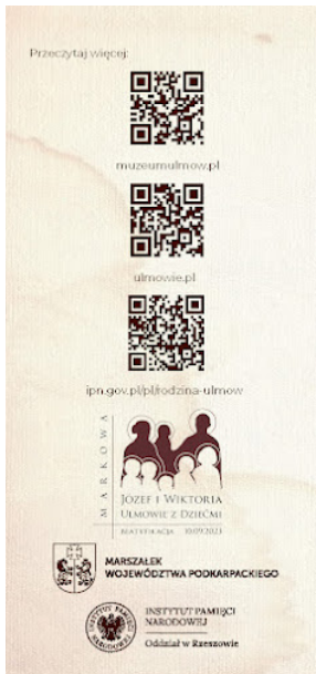
Broszura Rodzina Ulmów 012