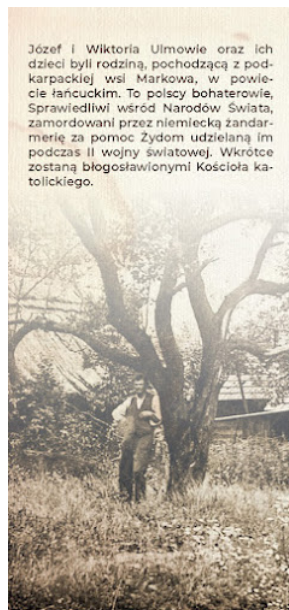
Broszura Rodzina Ulmów 002