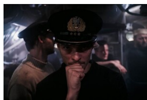
Kadry z filmu „Orzeł. Ostatni patrol”.

Przygotowanie wiernej rekonstrukcji wnętrza okrętu ORP „Orzeł” zajęło ponad rok. W jego stworzeniu wzięli udział historycy, konsultanci oraz oficerowie i marynarze, którzy służyli na bliźniaczym okręcie ORP „Sęp”. Dzięki użyciu nowoczesnej technologii modułowej oraz zastosowaniu specjalnej platformy hydraulicznej udało się niezwykle realistycznie odwzorować zachowanie okrętu podczas wynurzeń, zanurzeń oraz w czasie wybuchów bomb głębinowych. Zdjęcia na Bałtyku zrealizowano przy współpracy z Ministerstwem Obrony Narodowej i udziale jednostek z 3. Flotylli Okrętów i 8. Flotylli Obrony Wybrzeża.