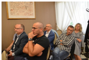
Konferencja popularnonaukowa poświęcone pamięci 24. Pułku Ułanów im. Hetmana Wielkiego Koronnego Stanisława Żółkiewskiego - Rzeszów, 9 września 2022.