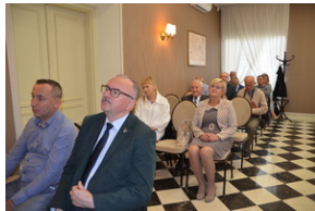
Konferencja popularnonaukowa poświęcone pamięci 24. Pułku Ułanów im. Hetmana Wielkiego Koronnego Stanisława Żółkiewskiego - Rzeszów, 9 września 2022.