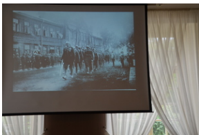
Konferencja popularnonaukowa poświęcone pamięci 24. Pułku Ułanów im. Hetmana Wielkiego Koronnego Stanisława Żółkiewskiego - Rzeszów, 9 września 2022.