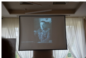
Konferencja popularnonaukowa poświęcone pamięci 24. Pułku Ułanów im. Hetmana Wielkiego Koronnego Stanisława Żółkiewskiego - Rzeszów, 9 września 2022.