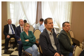
Konferencja popularnonaukowa poświęcone pamięci 24. Pułku Ułanów im. Hetmana Wielkiego Koronnego Stanisława Żółkiewskiego - Rzeszów, 9 września 2022.