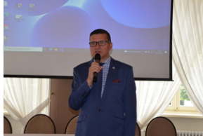
Konferencja popularnonaukowa poświęcone pamięci 24. Pułku Ułanów im. Hetmana Wielkiego Koronnego Stanisława Żółkiewskiego - Rzeszów, 9 września 2022.