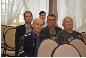
Konferencja popularnonaukowa poświęcone pamięci 24. Pułku Ułanów im. Hetmana Wielkiego Koronnego Stanisława Żółkiewskiego - Rzeszów, 9 września 2022.