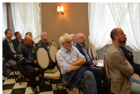
Konferencja popularnonaukowa poświęcone pamięci 24. Pułku Ułanów im. Hetmana Wielkiego Koronnego Stanisława Żółkiewskiego - Rzeszów, 9 września 2022.