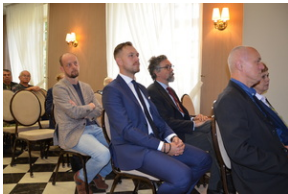
Konferencja popularnonaukowa poświęcone pamięci 24. Pułku Ułanów im. Hetmana Wielkiego Koronnego Stanisława Żółkiewskiego - Rzeszów, 9 września 2022.