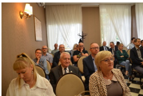
Konferencja popularnonaukowa poświęcone pamięci 24. Pułku Ułanów im. Hetmana Wielkiego Koronnego Stanisława Żółkiewskiego - Rzeszów, 9 września 2022.