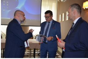
Konferencja popularnonaukowa poświęcone pamięci 24. Pułku Ułanów im. Hetmana Wielkiego Koronnego Stanisława Żółkiewskiego - Rzeszów, 9 września 2022.