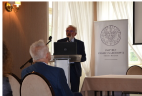
Konferencja popularnonaukowa poświęcone pamięci 24. Pułku Ułanów im. Hetmana Wielkiego Koronnego Stanisława Żółkiewskiego - Rzeszów, 9 września 2022.