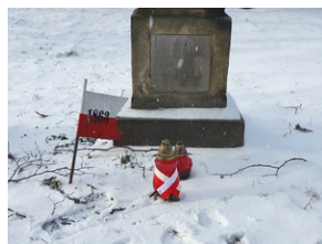
Grób Jakóba Holzera na Starym Cmentarzu w Rzeszowie.