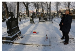
Grób Jana Marcinkiewicza na Starym Cmentarzu w Rzeszowie.