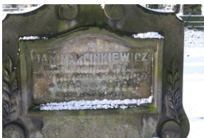
Grób Jana Marcinkiewicza na Starym Cmentarzu w Rzeszowie.