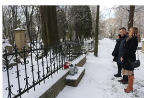
Mogiła Powstańców Styczniowych na Starym Cmentarzu w Rzeszowie.