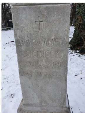
Grób Wacława Sicińskiego na Starym Cmentarzu w Rzeszowie.