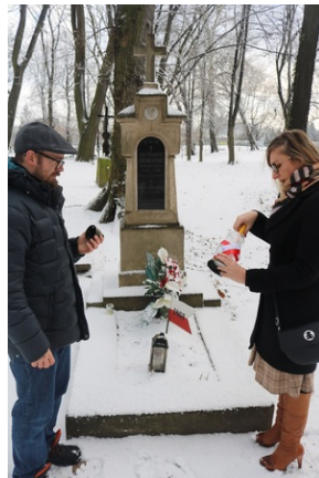
Grób Jana Zygmunta Ziemiańskiego na Starym Cmentarzu w Rzeszowie.

Na cmentarzu znajduje się zbiorowa mogiła/pomnik 7 Powstańców styczniowych, którzy walczyli pod dowództwem płk. Leona Czechowski m.in. w walkach pod Potokiem i Banachami, gdzie zostali ciężko ranni. W mogile zostali pochowani: