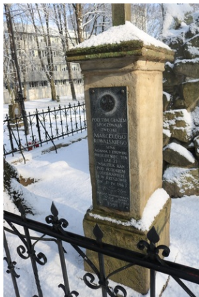
Mogiła Powstańców Styczniowych na Starym Cmentarzu w Rzeszowie.