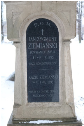
Grób Jana Zygmunta Ziemiańskiego na Starym Cmentarzu w Rzeszowie.