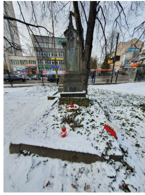
Grób Kazimierza Kraussa na Starym Cmentarzu w Rzeszowie.