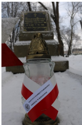
Grób Henryka Stroki na Starym Cmentarzu w Rzeszowie.