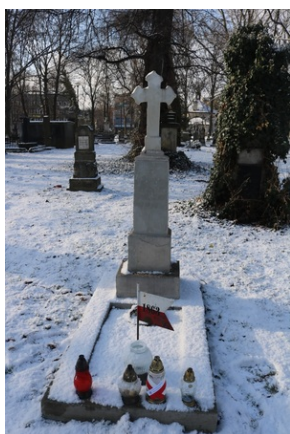
Grób Wacława Sicińskiego na Starym Cmentarzu w Rzeszowie.