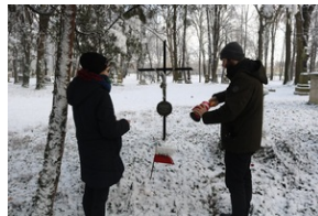
Grób Jana Tomasza Sadowskiego na Starym Cmentarzu w Rzeszowie.