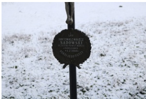
Grób Jana Tomasza Sadowskiego na Starym Cmentarzu w Rzeszowie.