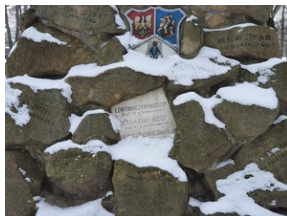
Mogiła Powstańców Styczniowych na Starym Cmentarzu w Rzeszowie.