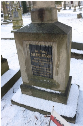
Grób Jana Nieziółomskiego na Starym Cmentarzu w Rzeszowie.