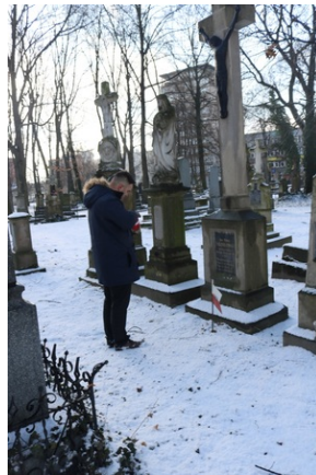
Grób Jana Nieziółomskiego na Starym Cmentarzu w Rzeszowie.