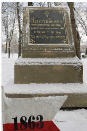
Grób Henryka Stroki na Starym Cmentarzu w Rzeszowie.