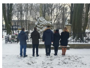
Mogiła Powstańców Styczniowych na Starym Cmentarzu w Rzeszowie.

Na cmentarzu została pochowana również Joanna Cielecka h. Zaremba (1812-1901), opiekunka rannych i zmarłych żołnierzy polskich z 1863 r., wielki darczyńca Powstania Styczniowego