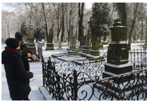
Grób Antoniego Opolskiego na Starym Cmentarzu w Rzeszowie.