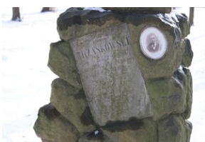
Grób Ignacego Trzaskowskiego na Starym Cmentarzu w Rzeszowie.