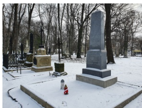
Grób Ludwika Schnaittera na Starym Cmentarzu w Rzeszowie.