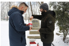
Grób Henryka Stroki na Starym Cmentarzu w Rzeszowie.