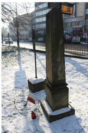
Grób Jakóba Holzera na Starym Cmentarzu w Rzeszowie.