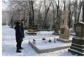
Grób Mikołaja Kaczorowskiego na Starym Cmentarzu w Rzeszowie.