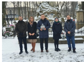
Mogiła Powstańców Styczniowych na Starym Cmentarzu w Rzeszowie.