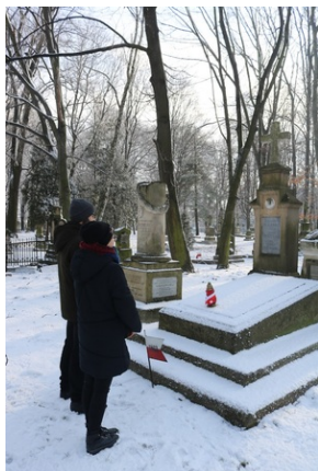
Grób Wiktora Adama Zbyszewskiego na Starym Cmentarzu w Rzeszowie.