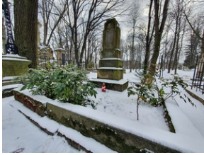
Grób Antoniego Kluzy na Starym Cmentarzu w Rzeszowie.