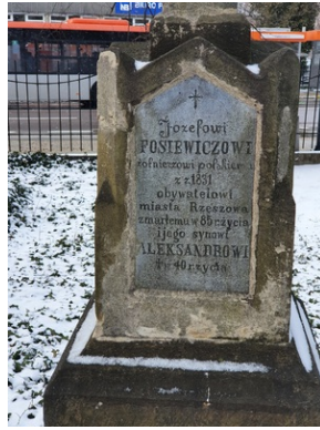
Grób Józefa Fosiewicza na Starym Cmentarzu w Rzeszowie.