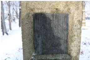
Grób Tadeusza Jabłońskiego na Starym Cmentarzu w Rzeszowie.