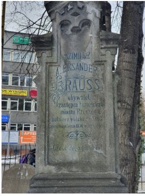
Grób Kazimierza Kraussa na Starym Cmentarzu w Rzeszowie.