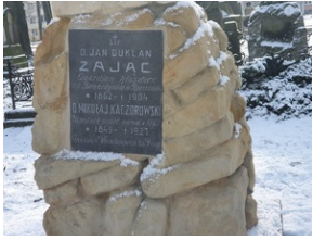
Grób Mikołaja Kaczorowskiego na Starym Cmentarzu w Rzeszowie.