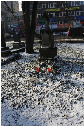
Grób Józefa Fosiewicza na Starym Cmentarzu w Rzeszowie.