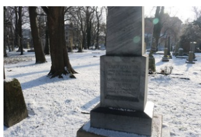
Grób Ignacego Schnaittera na Starym Cmentarzu w Rzeszowie.