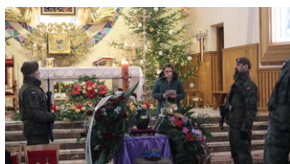
Uroczystości pogrzebowe por. Henryk Władysław Ateborski ps. „Pancerny” - Nowa Sarzyna, 4 stycznia 2022