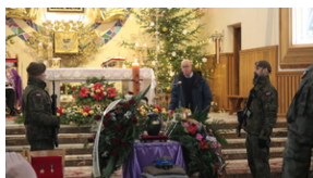
Uroczystości pogrzebowe por. Henryk Władysław Ateborski ps. „Pancerny” - Nowa Sarzyna, 4 stycznia 2022, Fot. Joanna Kudyba IPN O/Rzeszów