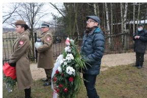
Uroczystości pogrzebowe por. Henryk Władysław Ateborski ps. „Pancerny” - Ruda Łańcucka, 4 stycznia 2022