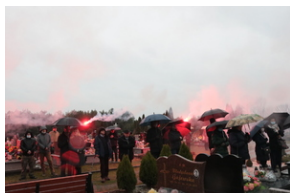
Uroczystości pogrzebowe por. Henryk Władysław Ateborski ps. „Pancerny” - Ruda Łańcucka, 4 stycznia 2022