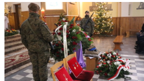
Uroczystości pogrzebowe por. Henryk Władysław Ateborski ps. „Pancerny” - Nowa Sarzyna, 4 stycznia 2022