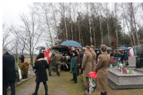
Uroczystości pogrzebowe por. Henryk Władysław Ateborski ps. „Pancerny” - Ruda Łańcucka, 4 stycznia 2022