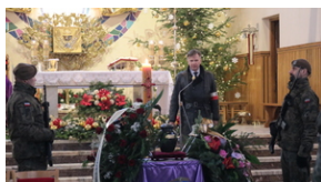
Uroczystości pogrzebowe por. Henryk Władysław Ateborski ps. „Pancerny” - Nowa Sarzyna, 4 stycznia 2022