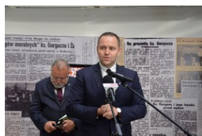
Wystawa „Ks. Władysław Gurgacz. Kapelan Polski Podziemnej”.