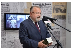
Wystawa „Ks. Władysław Gurgacz. Kapelan Polski Podziemnej”.