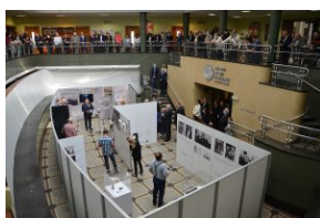
Wystawa „Ks. Władysław Gurgacz. Kapelan Polski Podziemnej”.