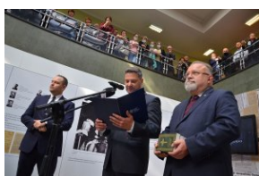
Wystawa „Ks. Władysław Gurgacz. Kapelan Polski Podziemnej”.