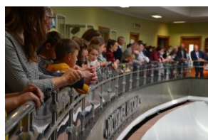
Wystawa „Ks. Władysław Gurgacz. Kapelan Polski Podziemnej”.