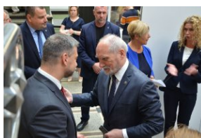
Wystawa „Ks. Władysław Gurgacz. Kapelan Polski Podziemnej”.