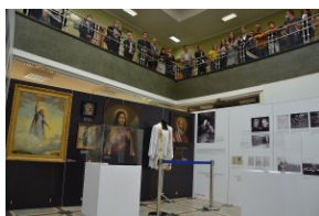
Wystawa „Ks. Władysław Gurgacz. Kapelan Polski Podziemnej”.