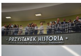
Wystawa „Ks. Władysław Gurgacz. Kapelan Polski Podziemnej”.