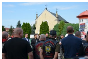
„Edukacyjny Rajd Motocyklowy – walka o kształt granicy wschodniej – cz. II”