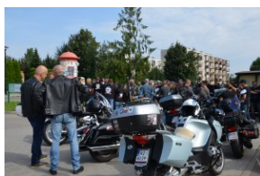
„Edukacyjny Rajd Motocyklowy – walka o kształt granicy wschodniej – cz. II”