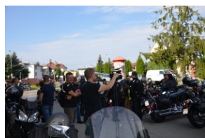
„Edukacyjny Rajd Motocyklowy – walka o kształt granicy wschodniej – cz. II”