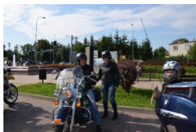
„Edukacyjny Rajdy Motocyklowy – walka o kształt granicy wschodniej – cz. II”