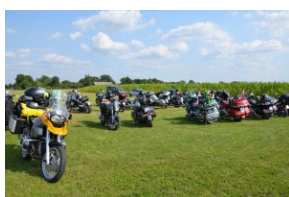
„Edukacyjny Rajdy Motocyklowy – walka o kształt granicy wschodniej – cz. II”