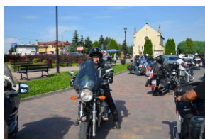
„Edukacyjny Rajdy Motocyklowy – walka o kształt granicy wschodniej – cz. II”