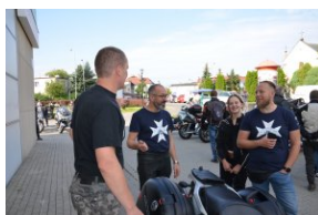
„Edukacyjny Rajd Motocyklowy – walka o kształt granicy wschodniej – cz. II”