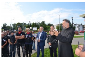
„Edukacyjny Rajd Motocyklowy – walka o kształt granicy wschodniej – cz. II”