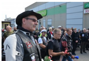
„Edukacyjny Rajd Motocyklowy – walka o kształt granicy wschodniej – cz. II”