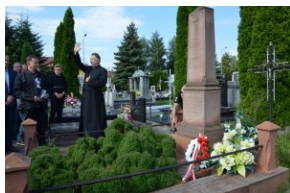
„Edukacyjny Rajdy Motocyklowy – walka o kształt granicy wschodniej – cz. II”