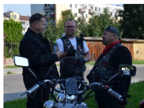
„Edukacyjny Rajd Motocyklowy – walka o kształt granicy wschodniej – cz. II”

Rajd został ze względów epidemicznych zaplanowany jako jednodniowy i był kontynuacją ubiegłorocznej trasy po miejscach walk o granicę wschodnią II Rzeczypospolitej