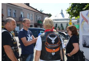
„Edukacyjny Rajdy Motocyklowy – walka o kształt granicy wschodniej – cz. II”