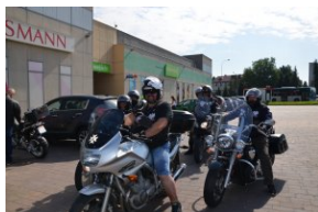
„Edukacyjny Rajdy Motocyklowy – walka o kształt granicy wschodniej – cz. II”