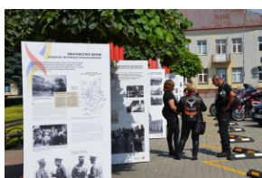
„Edukacyjny Rajdy Motocyklowy – walka o kształt granicy wschodniej – cz. II”