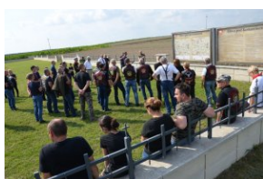
„Edukacyjny Rajdy Motocyklowy – walka o kształt granicy wschodniej – cz. II”