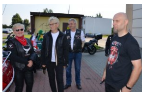
„Edukacyjny Rajd Motocyklowy – walka o kształt granicy wschodniej – cz. II”