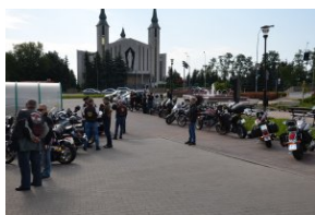
„Edukacyjny Rajd Motocyklowy – walka o kształt granicy wschodniej – cz. II”