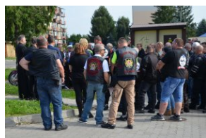
„Edukacyjny Rajd Motocyklowy – walka o kształt granicy wschodniej – cz. II”