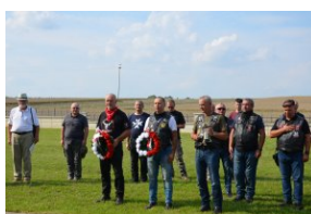
„Edukacyjny Rajdy Motocyklowy – walka o kształt granicy wschodniej – cz. II”