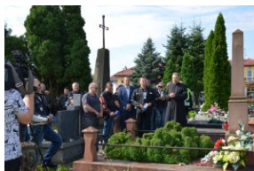
„Edukacyjny Rajdy Motocyklowy – walka o kształt granicy wschodniej – cz. II”