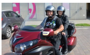
„Edukacyjny Rajdy Motocyklowy – walka o kształt granicy wschodniej – cz. II”