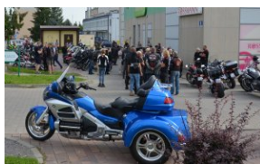
„Edukacyjny Rajd Motocyklowy – walka o kształt granicy wschodniej – cz. II”