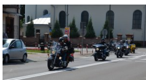
„Edukacyjny Rajdy Motocyklowy – walka o kształt granicy wschodniej – cz. II”