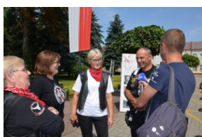
„Edukacyjny Rajdy Motocyklowy – walka o kształt granicy wschodniej – cz. II”