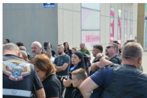
„Edukacyjny Rajdy Motocyklowy – walka o kształt granicy wschodniej – cz. II”