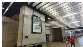
Kampania promocyjna projektu IPN „Giganci nauki PL” na dworcach PKP w Warszawie – czerwiec 2021