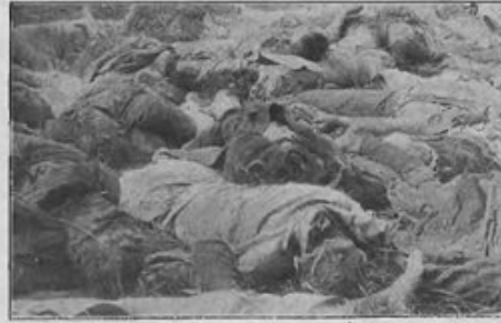
Wzięci do niewoli, rozstrzelani i wyrzuceni samolotami we wsi Lemoniaż zicami łomżyńskiej pow. łomżyńskiej: 1 pluton 60 p. p., 37 żołnierzy i 5 cywilnych z II-go batalionu Kowieńskiego p. p. dnia 25-go lipca 1920 roku. Pochowani zostali przez ludność m. Kólna.