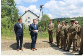
Odsłonięcie tablicy upamiętniającej zamordowanych Polaków z rąk ukraińskich nacjonalistów w Zatwarnicy.