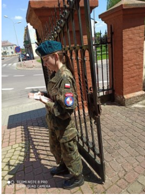
Strzelcy rozdający ulotki zachęcające do udziału w akcji „11 lipca zapal Znicz Pamięci”.