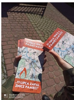
Strzelcy rozdający ulotki zachęcające do udziału w akcji „11 lipca zapal Znicz Pamięci”.