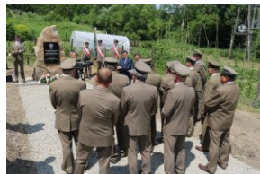
Odsłonięcie tablicy upamiętniającej zamordowanych Polaków z rąk ukraińskich nacjonalistów w Zatwarnicy.