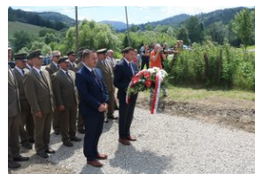
Odsłonięcie tablicy upamiętniającej zamordowanych Polaków z rąk ukraińskich nacjonalistów w Zatwarnicy.