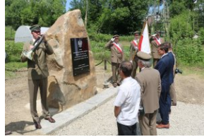
Odsłonięcie tablicy upamiętniającej zamordowanych Polaków z rąk ukraińskich nacjonalistów w Zatwarnicy.