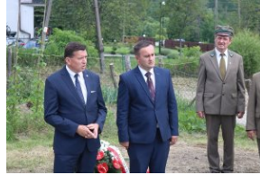
Odsłonięcie tablicy upamiętniającej zamordowanych Polaków z rąk ukraińskich nacjonalistów w Zatwarnicy.