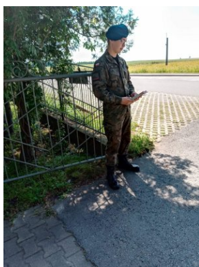
Strzelcy rozdający ulotki zachęcające do udziału w akcji „11 lipca zapal Znicz Pamięci”.