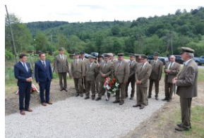
Odsłonięcie tablicy upamiętniającej zamordowanych Polaków z rąk ukraińskich nacjonalistów w Zatwarnicy.