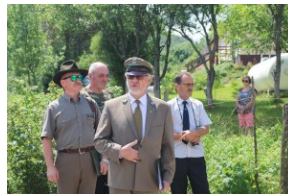
Odsłonięcie tablicy upamiętniającej zamordowanych Polaków z rąk ukraińskich nacjonalistów w Zatwarnicy.