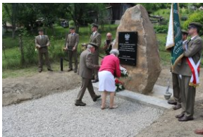
Odsłonięcie tablicy upamiętniającej zamordowanych Polaków z rąk ukraińskich nacjonalistów w Zatwarnicy.