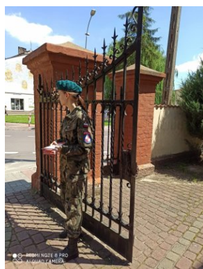
Strzelcy rozdający ulotki zachęcające do udziału w akcji „11 lipca zapal Znicz Pamięci”.

W niedzielę 5 lipca 11 lipca 2020 r. Strzelcy na terenie powiatu lubaczowskiego zainaugurowali akcję rozdawania ulotek, przygotowanych przez IPN Oddział w Rzeszowie, zachęcających do udziału w akcji „11 lipca zapal Znicz Pamięci” i przypominających o masowej eksterminacji ludności polskiej.