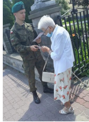
Strzelcy rozdający ulotki zachęcające do udziału w akcji „11 lipca zapal Znicz Pamięci”.