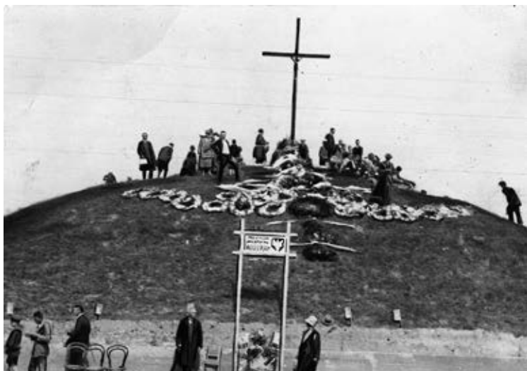
Kopiec ku czci poległych w Zadwórzcu podczas uroczystości w latach dwudziestych XX w. Fot. Marek Münz (zbiory Narodowego Archiwum Cyfrowego).

się donośnym echem rozpaczego bólu o stoki Golołóg, a strugami krwi zlewał żyzne pola prastarej Piastów Dzielnicy. (...) Heroiczny wysiłek młodych rycerzy, krew wytoczona z serc gorejących, nie poszły na marne. Ciałami swemi powstrzymali napór wroga, a ten wśród splotu dalszych wypadków wojennych począł czem rychlej ustępować z Polski w granice własnych posiadłości. Tam zaś, wśród rozległych niw Zadwórzca, wyrosły nad popiołami prawych synów Ojczyzny trzy kurhany mogilne, cel corocznej pielgrzymki mnogich mieszkańców Lwowa, miejsce godne zaiste wzniesienia wiekopomnego monumentu”. W 1928 r. na szczycie kurhanu odsłonięto pomnik w formie słupa granicznego, według projektu architekta Wawrzyńca Dajczaka, a u podnóża umieszczono tablicę z napisem: „Orlątom, poległym w dniu 17 sierpnia 1920 r. w walkach o całość ziem kresowych”. Cmentarze tych najmłodszych obrońców Kresów były miejscem pielgrzymek i uroczystości. W 1925 r. matka poległego