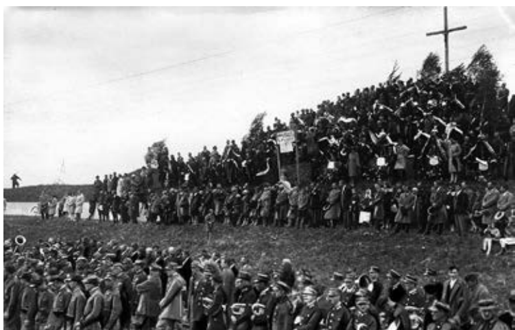
Obchody rocznicowe na polu bitwy pod Zadwórzem. Zadwórze 1930.