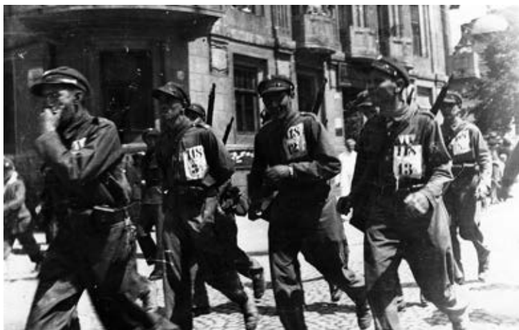
Drużyna Związku Strzeleckiego na trasie V. Marszu Zadwórzeńskiego. Lwów 1931.