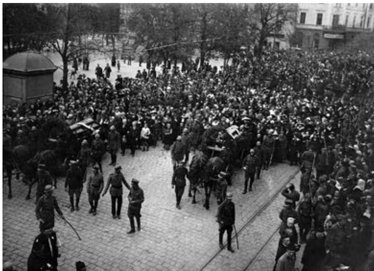
„Wdzięczny Lwów swym obrońcom poległym pod Zadwórzem”. Fot. Marek Münz, Lwów 1920 (zbiory Narodowego Archiwum Cyfrowego).

20 sierpnia 1920 r. do Zadwórze przyjechał pociąg pancerny nr 10 „Pionier”. Pobojuwisko przedstawiało straszny widok. Zmasakrowane, odarte z mundurów i obrabowane ciała