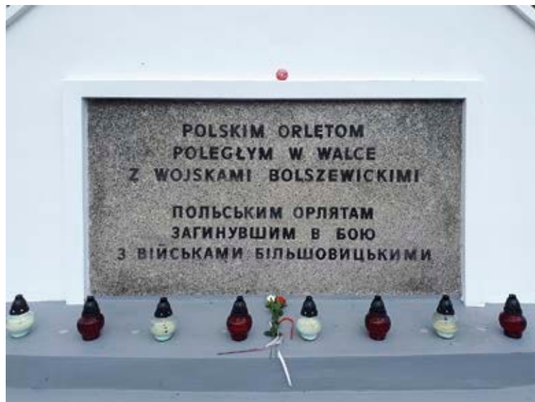
Tablica pamiątkowa u podnóża kopca w Zadwórz. Fot. Jacek Magdoń, Zadwórze 2019.