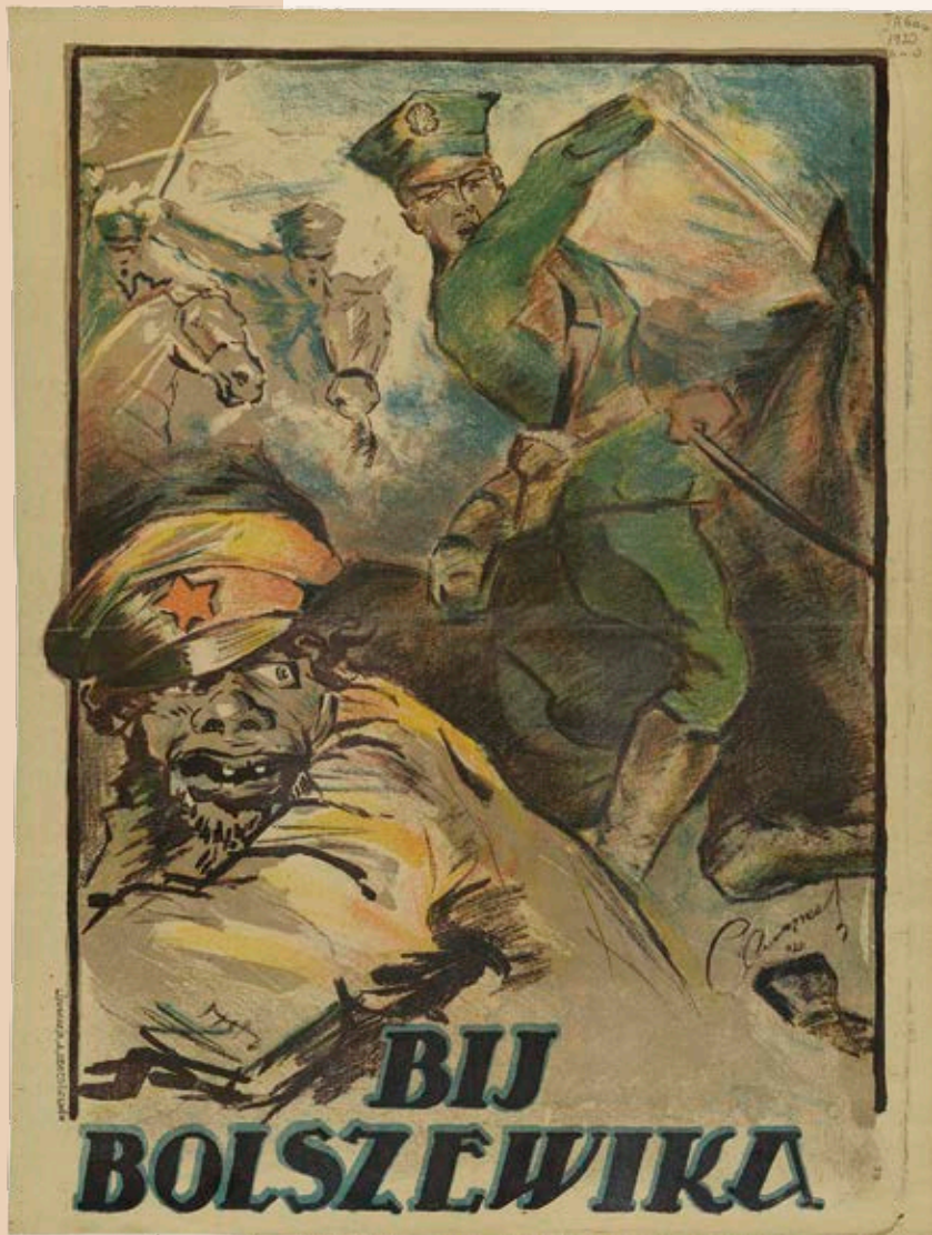
„Bij bolszewika!” – polski plakat propagandowy, Lwów 1920.