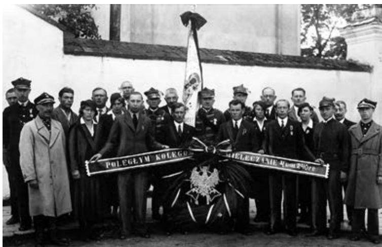
Przekazanie wieńca delegacji udającej się na uroczystości do Zadwórze przez uczestników bitwy – weteranów ochotniczego 240 pp. Fot. Wiktor Jaderny, Mielec 1935 (zbiory Narodowego Archiwum Cyfrowego).