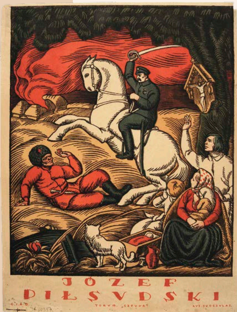
„Józef Piłsudski” – plakat z 1920 r., autorstwa Władysława Skoczylasa.