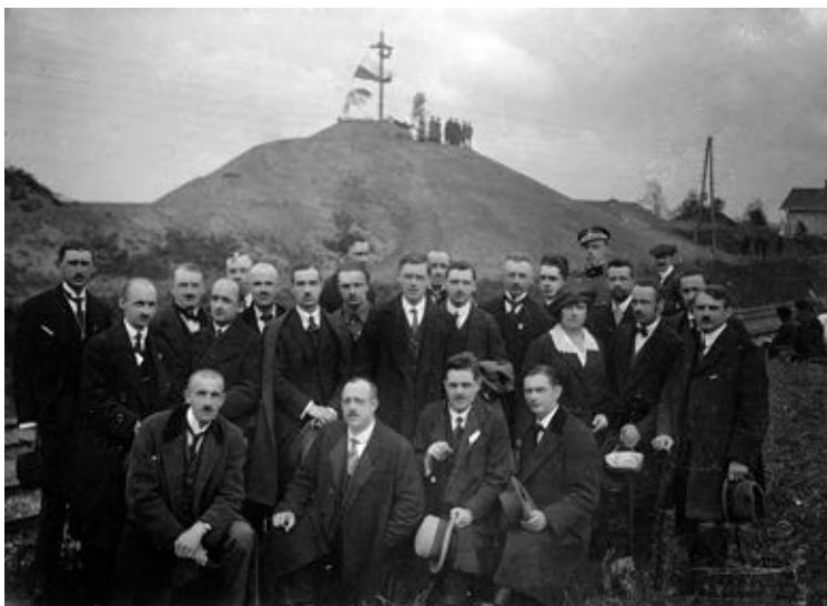
„Hold »Orlątom« na polach Zadwórze”. Uczestnicy walk z grupy majora Abrahama Fot. Marek Münz, Zadwórze 1921 (zbiory Biblioteki Narodowej w Warszawie).

polskich żołnierzy, które zaczęła już grzebać miejscowa ludność. Z pomocą przybyłych ze Lwowa rodzin przystąpiono do identyfikacji poległych i zamordowanych, ale rozpoznać zdołano niewielu. Bilans strat był porażający. Zwłoki siedmiu rozpoznanych obrońców, wraz z dowódcą, przewieziono do Lwowa. 18 września odbył się uroczysty pogrzeb, miasto oddało hołd swoim bohaterom, którzy spoczęli na Cmentarzu Obrońców Lwowa w kwaterze Zadwórzaków. Nie-rozpoznanych złożono w kurhanie, usypanym przy torach nieopodal budki dróżnika, około 1 kilometr od stacji kolejowej w Zadwórze i zwieńczonym krzyżem.