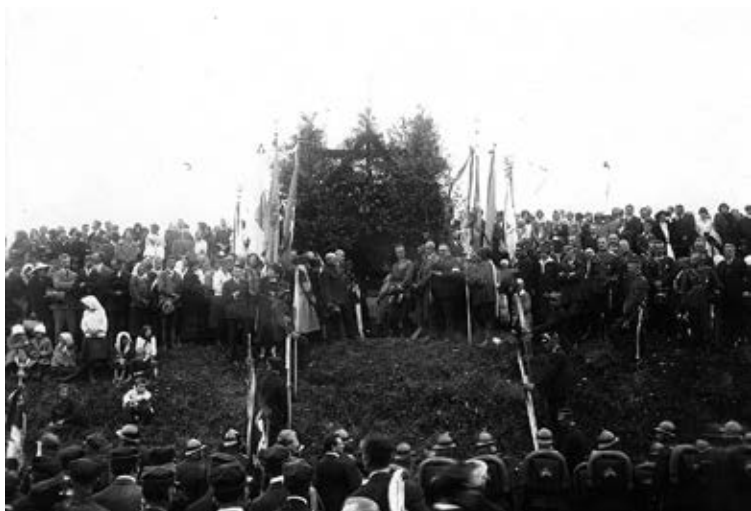
Msza polowa w rocznicę bitwy pod Zadwórzem w 1926 r. Koło ołtarza widoczny m.in. gen. Władysław Sikorski – dowódca Okręgu Korpusu Nr VI we Lwowie. Fot. Marek Münz, Zadwórze 1926 (zbiory Narodowego Archiwum Cyfrowego).