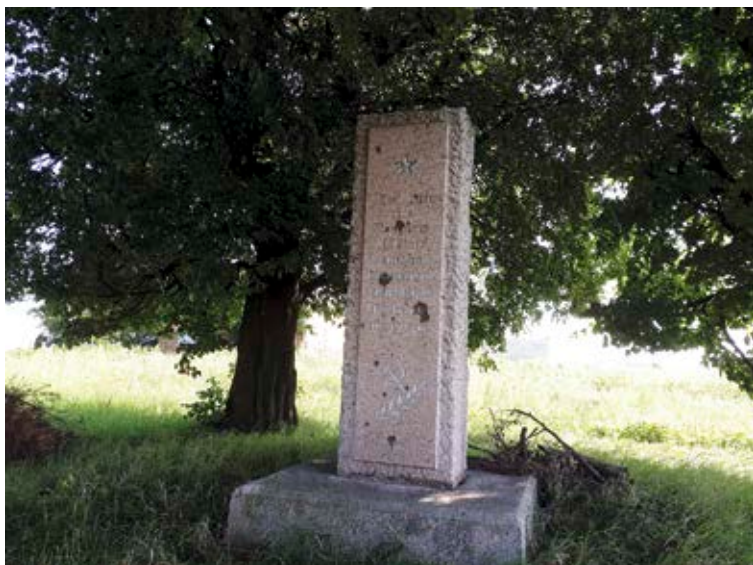
Sowiecki obelisk w miejscu stacjonowania I Armii Konnej w Zadwórzcu w 1920 r. Fot. Jacek Magdoń, Zadwórze 2018.

Zadwórze – wieś położona ok. 33 km na północny wschód od Lwowa, w miejscu, gdzie przecina się linia kolejowa ze Lwowa do Brodów i droga z Bóbrki do Kamionki Strumiłowej. W XX w. zamieszkała przez ludność katolicką różnych obrządków, której liczba wahała się od ok. 1500 do 1800 osób. Od północy opływa wieś potok Jaryczówka, zasilający Peltew, wpadającą do Bugu w Busku. W okresie II Rzeczypospolitej Polskiej administracyjnie przynależna do województwa lwowskiego, obecnie w ukraińskim obwodzie lwowskim.