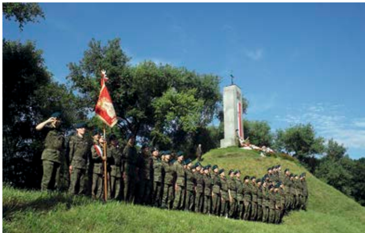
Pododdział reprezentacyjny Związku Strzeleckiego „Strzelec” uczestniczący w obchodach rocznicowych we Lwowie i Zadwórz. Fot. Jacek Magdoń, Zadwórze 2011.