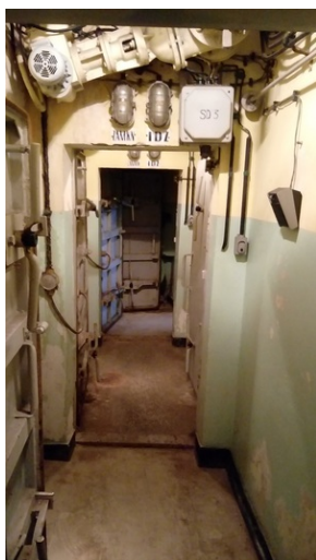
Prezentacja eksponatów i wyposażenia przeciwatomowego schronu „Marysieńka” w Rzeszowie.