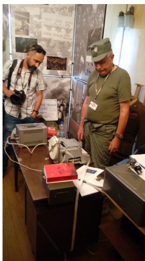
Prezentacja eksponatów i wyposażenia przeciwatomowego schronu „Marysieńka” w Rzeszowie.