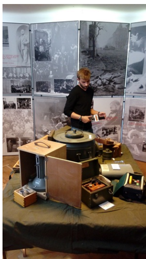
Prezentacja eksponatów i wyposażenia przeciwatomowego schronu „Marysieńka” w Rzeszowie.