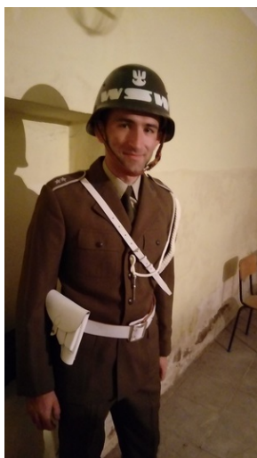
Prezentacja eksponatów i wyposażenia przeciwatomowego schronu „Marysieńka” w Rzeszowie.