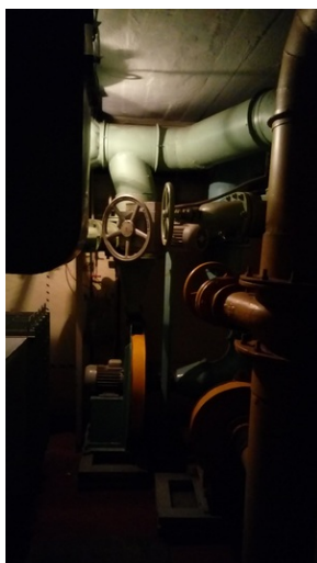
Prezentacja eksponatów i wyposażenia przeciwatomowego schronu „Marysieńka” w Rzeszowie.