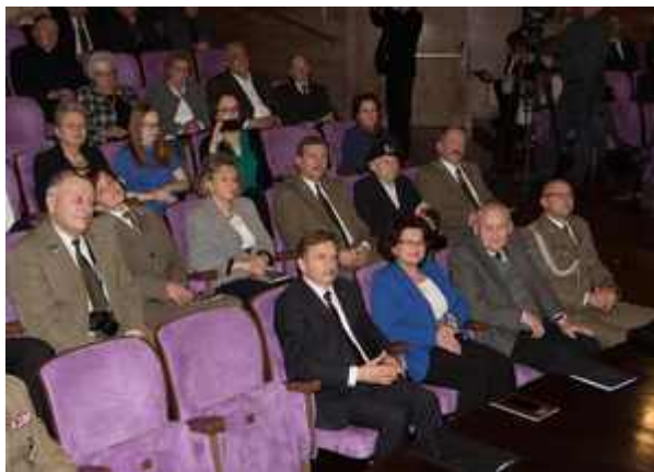
Uczestnicy gali V edycji Nagrody Honorowej "Świadek Historii"